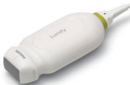
S4-1 phased array transducer