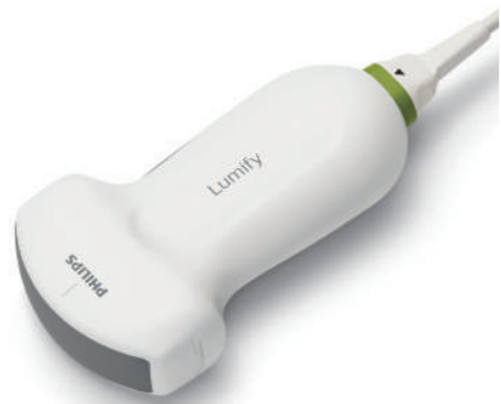
C5-2 broadband curved array transducer