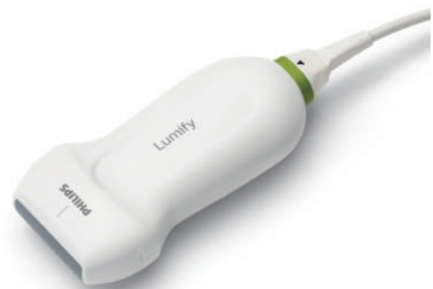
L12-4 broadband linear array transducer